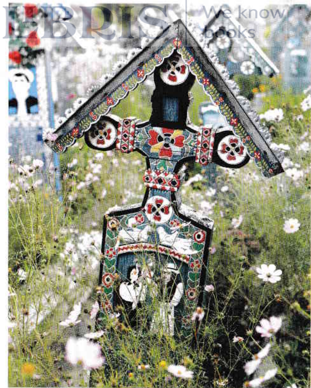
Săpânța - Cimitirul Vesel / Merry Cemetery / Fröhlichen Friedhof